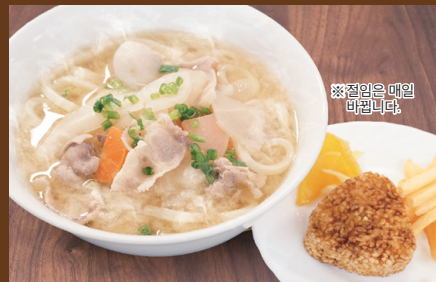
돼지국물 우동과 구운 주먹밥