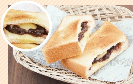
粒あんマーガリンサンド