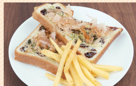
お好み焼き風トースト