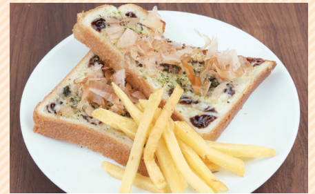
오코노미야키 풍 토스트