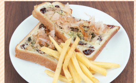
Okonomiyaki style toast