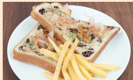
大阪烧风格烤面包 大阪燒風格烤面包