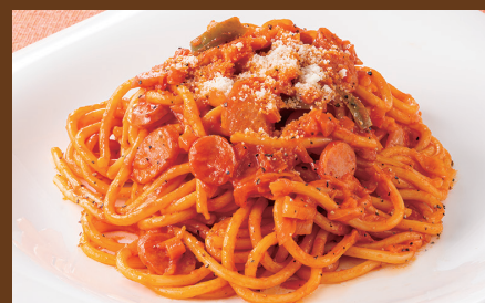
喫茶店の味! ナポリタン