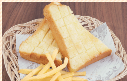
糖烤面包 / 糖烤面包