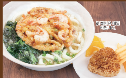
작은 새우와 구운 주먹밥을 넣은 우동