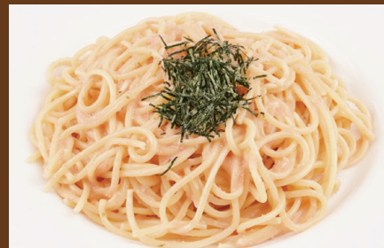
Tarako pasta (Cod roe Pasta)