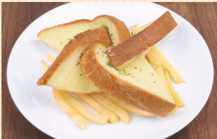
Shuriken garlic toast