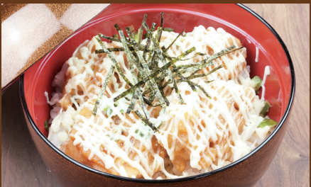
炸鸡蛋黄酱盖饭 雞塊蛋黃醬蓋飯