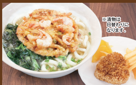
小海老かき揚げうどんと焼きおにぎり