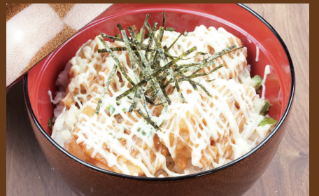
Fried Chicken Mayonnaise Rice Bowl