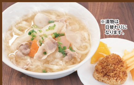
豚汁うどんと焼きおにぎり