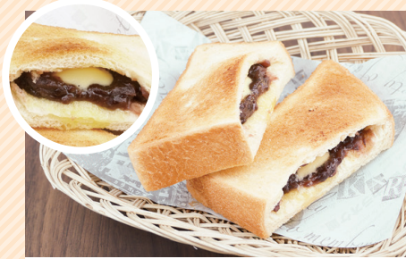
Sweetened red-bean paste margarine baked sandwiches