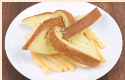
手裏剣ガーリックトースト