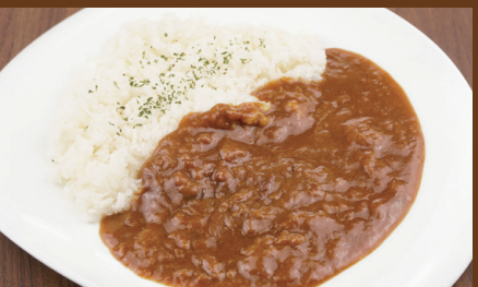
咖喱饭 / 咖哩飯