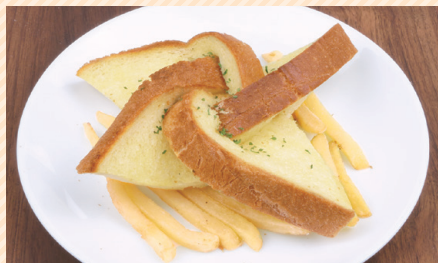
手里剑大蒜烤面包 手裡劍大蒜烤面包