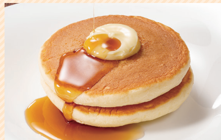
热香饼 / 热香饼