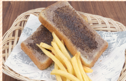
Cocoa margarine toast