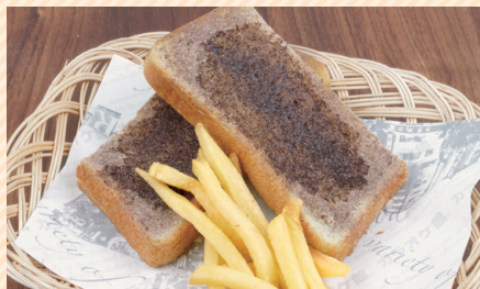
可可人造黄油烤面包 可可人造黄油烤面包